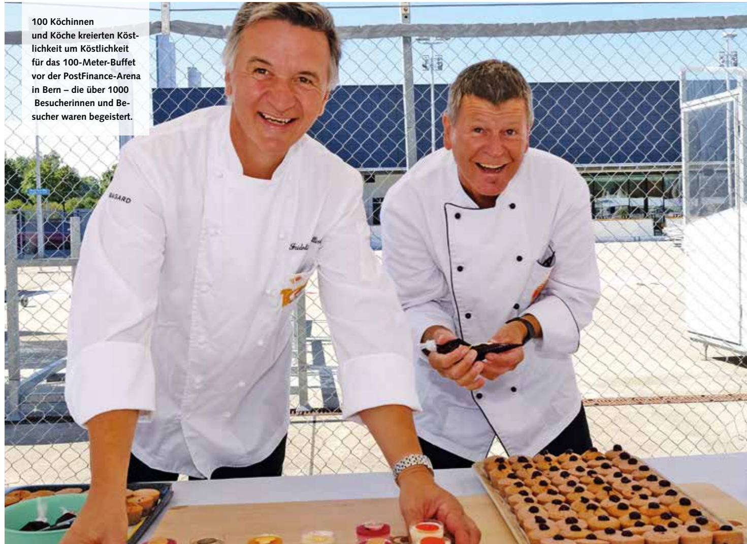
100 Köchinnen und Köche kreierten Köstlichkeit um Köstlichkeit für das 100-Meter-Bufferet vor der PostFinance-Arena in Bern – die über 1000 Besucherinnen und Besucher waren begeistert.